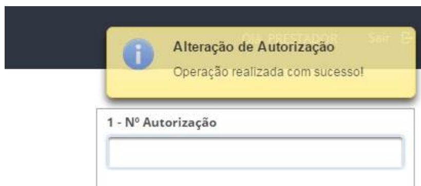
Imagem 13 – Mensagem de retorno ao usuário (Alteração de Autorização)

No botão ações, haverá as opções de editar e excluir autorização. Ao editar uma autorização, e salvar suas respectivas alterações, é exibida uma mensagem de sucesso ao usuário.