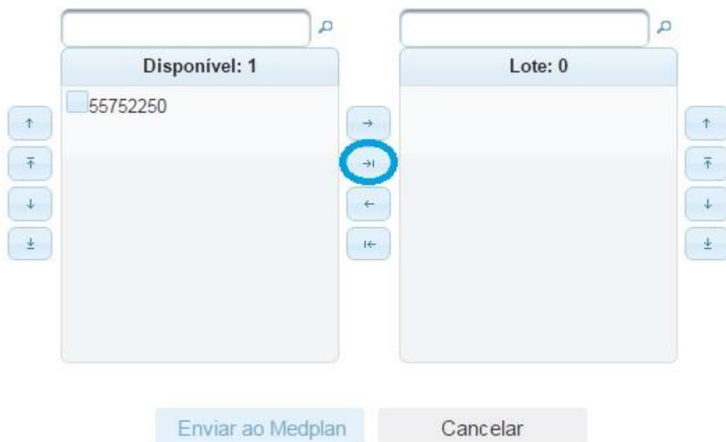
Imagem 17 – Botão para inserir todas autorizações em lote

Após inserir todas as autorizações no lote, é só enviar o lote ao Medplan. Lembrando que o botão Enviar ao Medplan só estará disponível entre os dias 20 e 25 de cada mês.