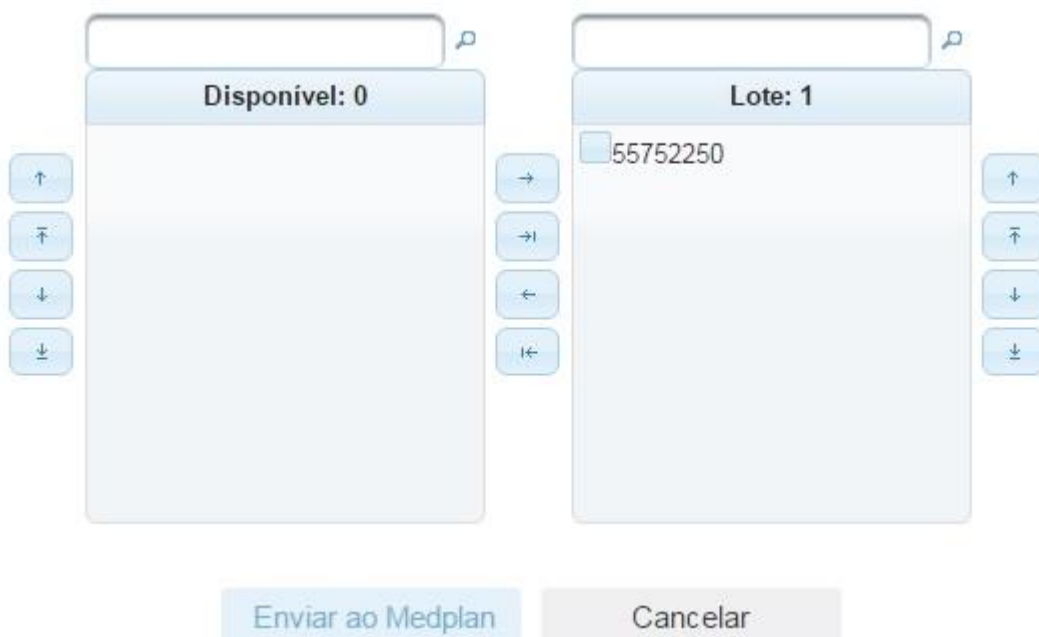
Imagem 18 – Botão enviar ao Medplan indisponível

Após inserir todas as autorizações no lote, é só enviar o lote ao Medplan. Lembrando que o botão Enviar ao Medplan só estará disponível entre os dias 20 e 25 de cada mês.