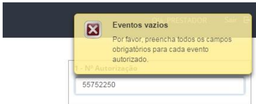
Imagem 9 – Alertas

Caso haja alguma incoerência nos dados preenchidos, o sistema irá alertar o usuário para que estes sejam corrigidos.