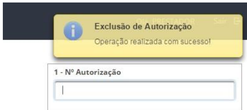
Imagem 14 – Mensagem de retorno ao usuário (Exclusão de Autorização)

Ao excluir uma autorização, será exibida uma caixa de confirmação de exclusão, que caso seja confirmada, é exibida uma mensagem de sucesso ao usuário.