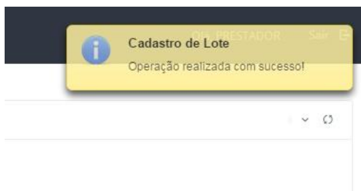
Imagem 20 – Mensagem de retorno ao usuário (Cadastro de Lote)

Logo abaixo, haverá uma tabela exibindo todos os lotes enviados ao Medplan.