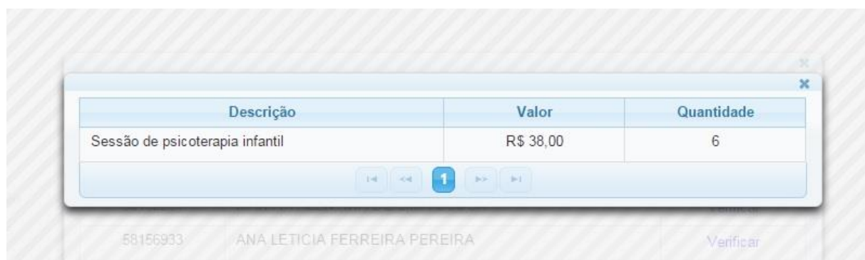
Imagem 23 – Caixa contendo todos procedimentos relacionados à autorização

E para cada autorização, também há a opção de Verificar todos os procedimentos (eventos) relacionados a esta autorização.