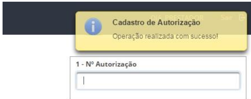
Imagem 11 – Mensagem de retorno ao usuário (Cadastro de Autorização)

Logo abaixo, haverá uma tabela exibindo todas as autorizações preenchidas disponíveis para inserção no lote.